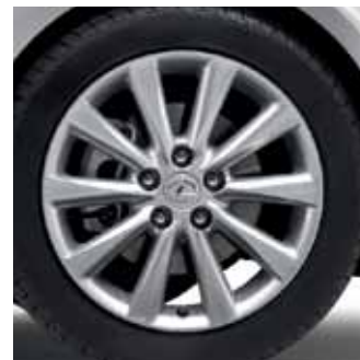
IS 250 IS 220d Comfort Sport Executive